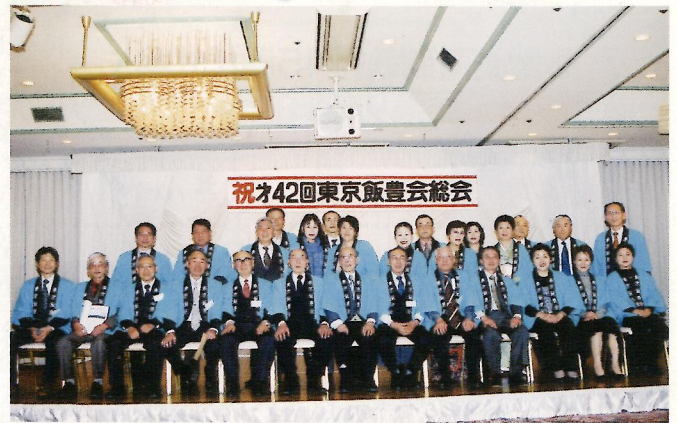
お世話役（役員さん）いつもありがとう