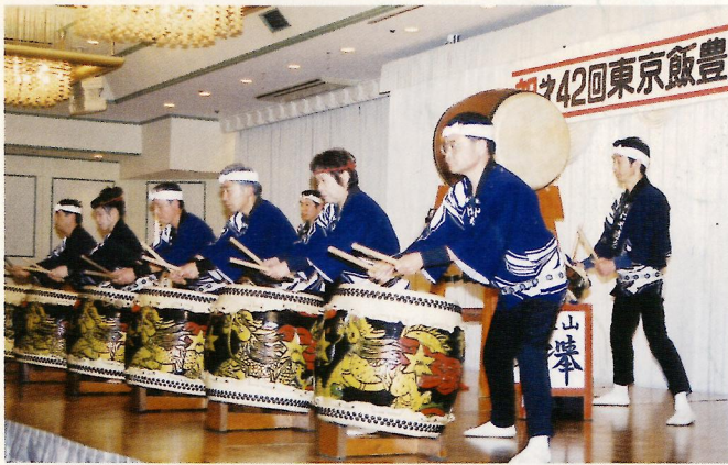
イベント狭山けやき会による和太鼓・熱演