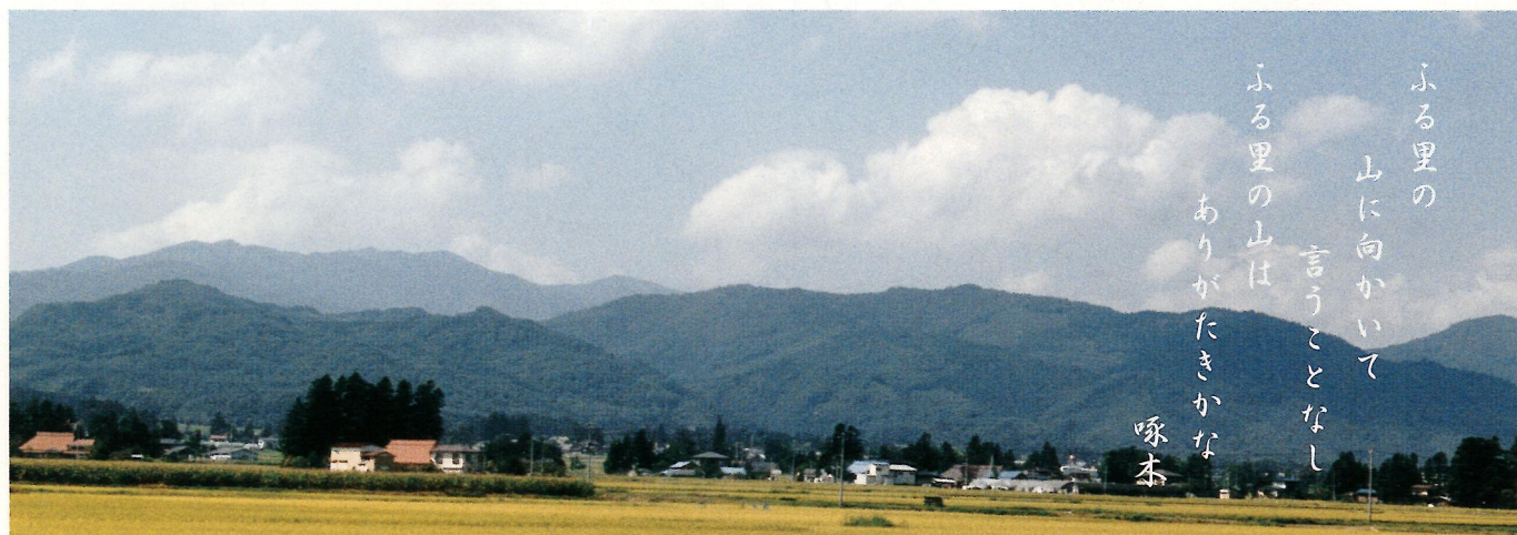
飯豊橋から椿地区を望む