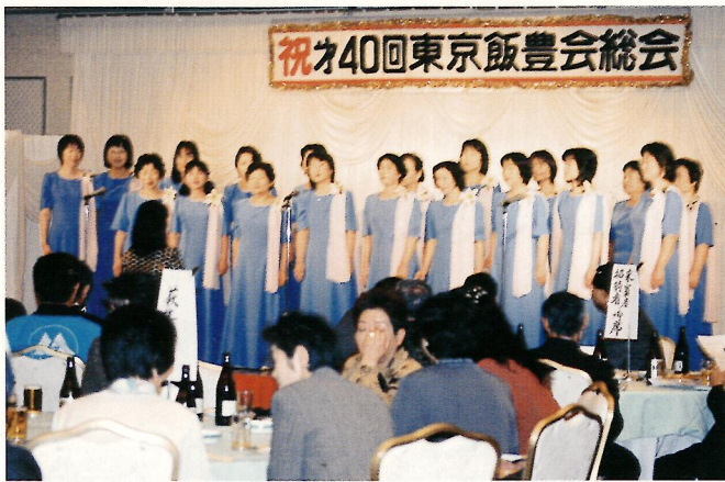
40回総会『コラールドめざみ』合唱団の歌声に感動のひと時