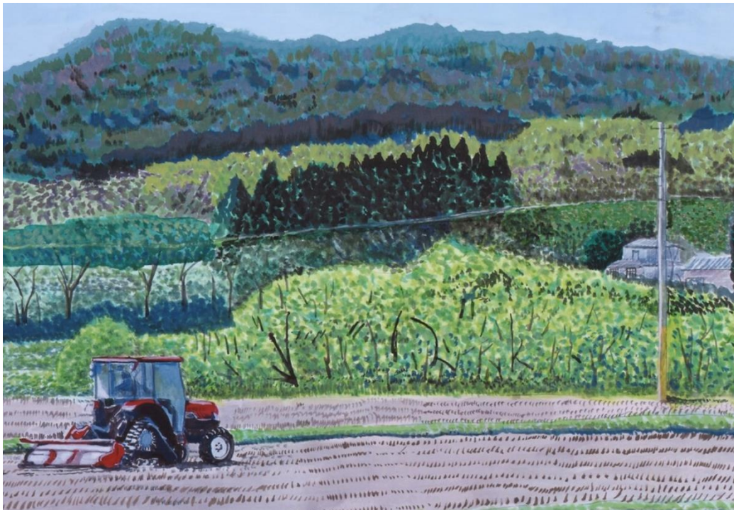
第59回こども県展 県展賞受賞作品 題名「山里の春」

飯豊町においても、このような農業の多面的機能を保全するためにも、皆様方一人ひとりの協力が大切と思われまますので更なるご指導、ご協力をお願いいたしまして年頭のあいさつとさせていただきます。