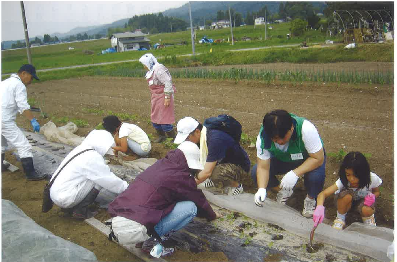
中地区での農作業体験

平成21年8月10日発行 飯豊町農業委員会 電話 0238(72)2111(代)