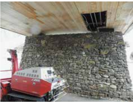
不調になったフォレストいいで