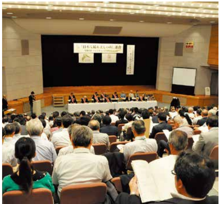
日本で最も美しい村連合総会（飯豊町会場）