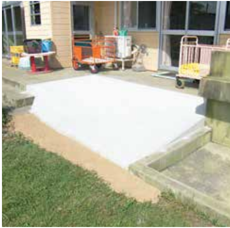
わくわくこども園改修