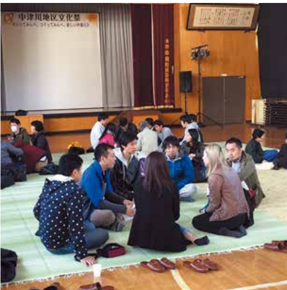
異業種の講演研修