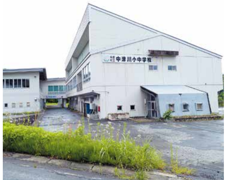
再利用が待たれる旧中津川小・中校舎