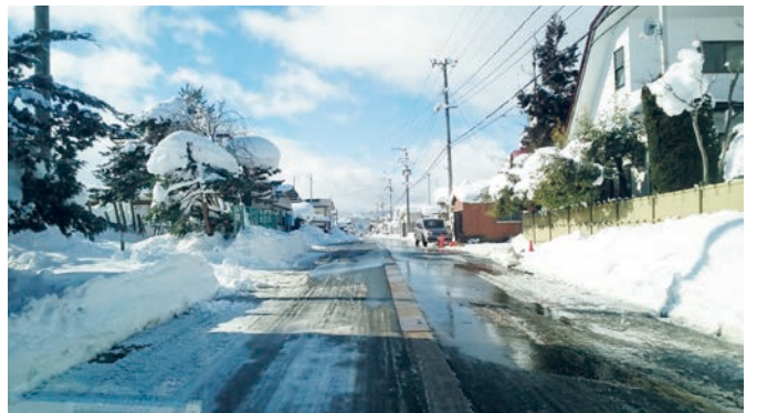
明治11年 イザベラバードが通った松原宿