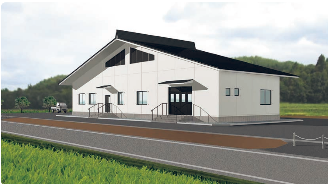
3月完成予定の手ノ子地区農集排処理施設