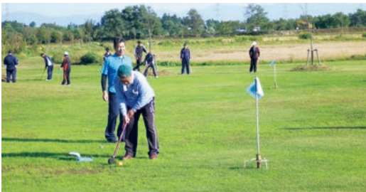
整備が待たれるすわんパーク

の事件に関して危機管 理の意識が低いのでは。 ◆ 町長 施設を整理し、 本来あるべき姿を検討 していきます。