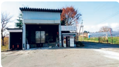
廃止される死亡獣畜保冷施設

国民の幅広い政治参加や地方議会における人材確保の観点から時代にふさわしい年金制度確立の法整備を求めるものです。