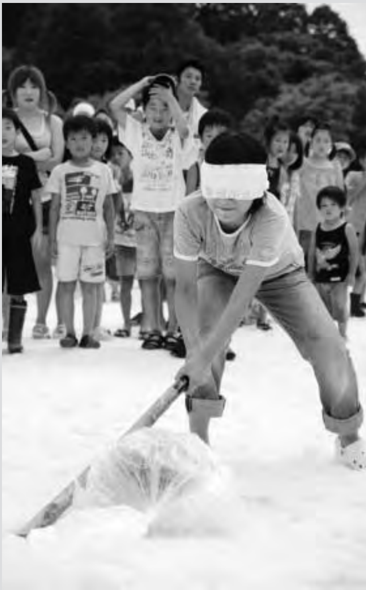
雪上のスイカ割り。割ればひんやりおいしいスイカにありつけそう

七月二十五日・二十六日の二日間、白川ダム湖岸公園で第十九回白川ダムSNOWえっぐフェスティバルが行われ、町内外から訪れた多くのお客様でにぎわいました。中津川地区内の雪室貯蔵施設で保存されていた十トトラック約八十台分の雪を会場に準備。たっぷり雪を敷き詰めた競技場が作られ、雪上で滑った距離を競う「雪上カーリング」や雪玉を投げて命中を競う「ストラックアウト」など盛りだくさんのアトラク