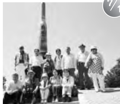
町国際交流協会中国大連市訪問 (中華人民共和国大連市)