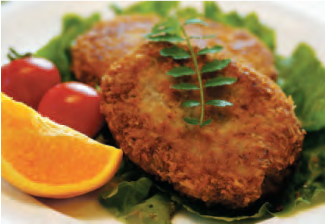
※写真は、コロケに利用した調理例です