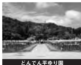
どんでん平ゆり園

開花状況は、促成栽培の植栽対応などにより、開園当初から通常料金での開園となり、比較的天候にも恵まれました。一方、入園者数では、団体客数の伸びはあったものの、ガソリン高騰などもあり個人入園者数が減となり、結果、6,200人の減となりました。しかしながら、人件費などの経費節減を図り、当期純利益は444万円となりました。