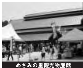
めざみの里観光物産館

(5月25日開催の株主総会にて、平成20年度第14期営業および決算報告などを承認)