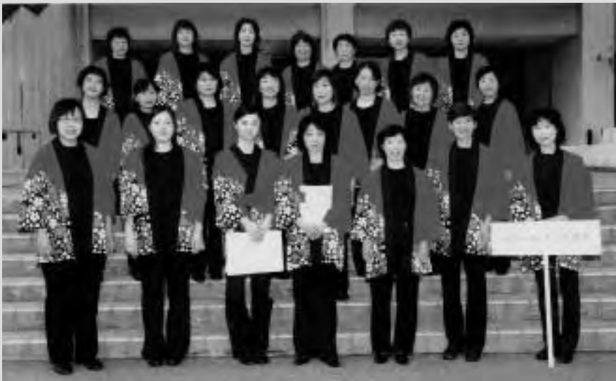
見事全国大会の切符を手にして喜ぶコラル・ド・めざまみのメンバー

それぞれに仕事を持ち、家庭がある中で、団員は全国大会に向けて日々練習に励んでいる。