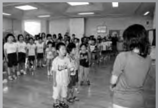
クリスティー先生へ今までの気持ちを込めて大きな声で歌のプレゼントを贈る添川小の子どもたち