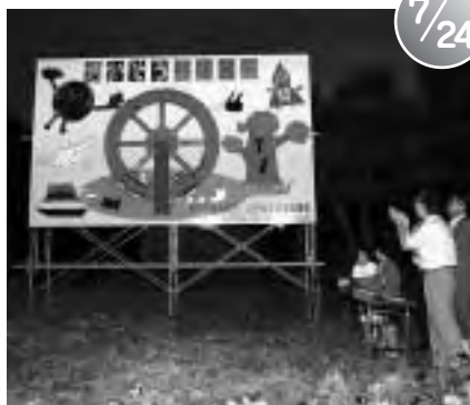
水力発電イルミネーション 点灯式 (松原地区白川公園内)