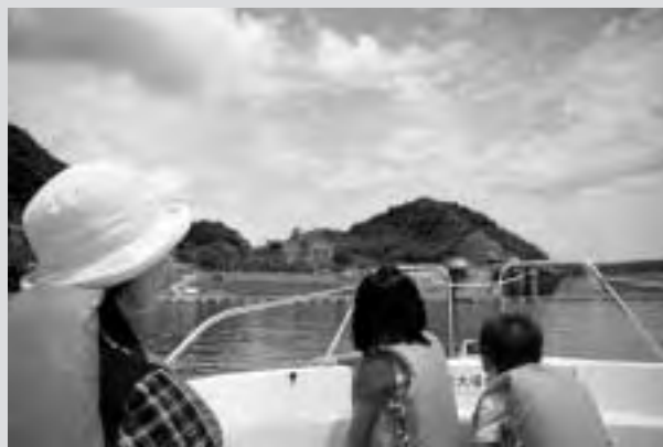
貯水池巡視体験を楽しむ親子。より一層ダムの大きさが実感できる

7月26日、白川ダムで「ダムとのふれあいの日」のイベントが開かれました。これは、白川ダムの目的や役割などについて知ってもらおうと、SNOWえっくフェスティバルに合わせて毎年開催されているものです。ダム内の監査廊見学やボートに乗っての貯水池巡視体験など、普段はなかなかできない体験ができるとあって、町内外から家族連れなど多くのお客様が訪れました。さらにイベント会場内には、流しそうめんの振る舞いが準備され、お客様は、つぎつぎと流れてくるそうめんを懸命にはしですくいながら、おいしそうにほお張っていました。