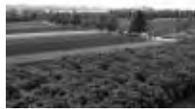
雨で香る富良野のラベンダー園

富良野のラベンダー園の人が教えてくれた 雨の日の方が香りが強くなると 町だってラベンダーのようにありたいと思った 厳しいときこそ、人を呼び込む魅力を発したいと