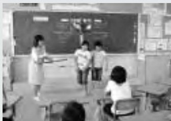
人間関係を学ぶ「セカンドステップ」で楽しく活動する子どもたち

そこで本校では、すべての教育活動を「心のやさしい子どもにするには」という視点で見直すと共に、より温かい人間関係を築くためのソ