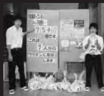
回収の実績と回収箱を示す生徒会執行部員。正面玄関に入って真ん前の場所に設置されている