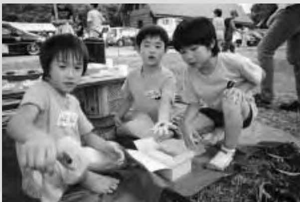
自分で捕まえたクワガタムシを見せ合う子どもたち

7月24日から27日までの4日間、中津川地区では都会の子どもたちを受け入れる夏休みふるさと山村留学が行われました。都会っ子に山村生活の素晴らしさを知ってもらおうと、中津川小中の保護者などが主催し毎年開催。今年は、埼玉県川口市の小学生18人が参加。子どもたちは、SNOWえっくフェスティバルの参加や農家への民泊、キャンプ、川遊びなどを通して、地元の人たちと交流し山村生活を楽しみました。参加した子どもたちからは「クワガタムシとカブトムシを捕まえることができたのでとってもうれしい」などの声が聞かれました。