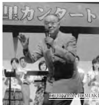
合唱指揮者 栗山文昭先生

身は全国に胸を張れるものとなっている。 音楽に少しでも関わっている人ならば、その講師陣に驚かされるだろう。まずは作曲家の池辺晋一郎先生。日本を代表する作曲家としてオペラ、舞台、映画と音楽活動の幅は広い。音楽業界だけではなく、映画監督や俳優からも一目置かれる存在である。