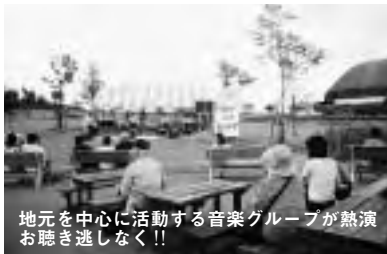
地元を中心に活動する音楽グループが熟演お聴き逃しなく!!

「フェット・ド・ラ・ミュージック」は、夏至の日に誰もが気軽に音楽と触れ親しむことができる「街角コンサート」です。飯豊町でも発祥の地であるフランス（パリ）と合わせて毎年開催しています。今回も「どんでん平ゆり園」が会場です。