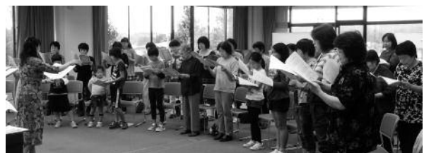
▲昨年の「四季の歌を歌う集い」の様子

毎年恒例となりました「四季の歌を歌う集い」を平成29年度も計4回開催します。四季折々の歌を一緒に楽しく歌いましょう♪