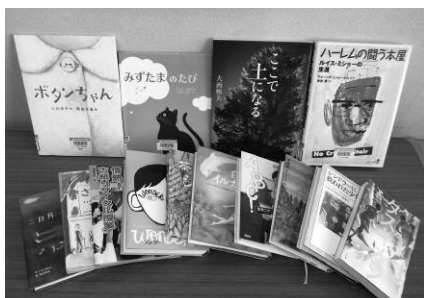
※全国課題図書の一例

平日は19:00まで(9/30まで、月曜・祝日は休館)開館していますので、ぜひご利用ください。