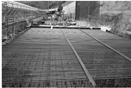
道路土台のコンクリート施工

なお、通行の安全を確保するため、やむを得ず一時的（数分間）に通行できない時間も生じますが、皆さまのご理解とご協力をよろしくお願いします。