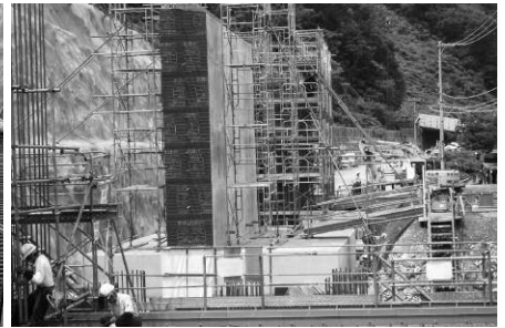
山側擁壁の施工状況