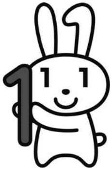
マイナンバー制度キャラクター 愛称「マイナちゃん」