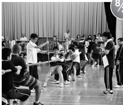
白樺健康体力づくりレクリエーション大会 (第二小学校)

8月9日、添川昭和地区で、同地区農地・水・環境保全会企画の「田んぼの生き物調査」が行われ、添川小5、6年の希望児童と同地区育成会が参加しました。講師に招かれた県職員から田や水路の役割とそこに住む生物について学んだ後、調査開始。事前に仕掛けた網かごでザリガニやコイ、アブラハヤなどを捕獲し、特徴の記録や体長計測、写真撮影などを行いました。調査結果は大判用紙にまとめられました。