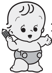
国勢調査イメージキャラクター センサスくん

国勢調査は、日本国内に住むすべての人と世帯を対象とする、国の最も重要な統計調査です。