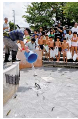
勢いよく泳ぎまわるヤマメ

9月5日、あ～すで「いいで“めざみの里”まつり2015」が開催されました。ちびっこ獅子やゆるキャラと遊ぼう、WA踊り、県出身歌手によるミニコンサートなどさまざまな催事が行われました。毎年恒例の魚のつかみ捕りは今年も子どもたちに大人気。開始時間前の池の周りには、準備万端の子どもたちとその保護者で黒山の人だかりが。スタートと同時に子どもたちはしぶきを上げて池に入り、夢中で魚を追っていました。