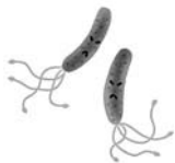
ピロリ菌のイメージ図

ピロリ菌は胃粘膜に住むらせん状の菌です。ピロリ菌は幼少時に感染し一度感染すると多くの場合除菌しない限り胃の中に住み続けます。やがて胃粘膜の炎症を引き起こし、慢性萎縮性胃炎と呼ばれる胃粘膜が薄く、萎縮した状態にしてしまいます。ピロリ菌の除菌治療を行うと胃粘膜の炎症が改善されるため、胃がんの発症を予防できると考えられます。除菌治療により胃がん発症を30%～50%抑える可能性があります。ピロリ菌が見つかるとも胃粘膜が萎縮していると胃がんになる可能性もあります。飯豊町では今年度から人間ドックにおいて胃がんリスク検診を行っています。胃がんは早期に発見することが重要です。1年に1回は胃がん検診を受けましょう。