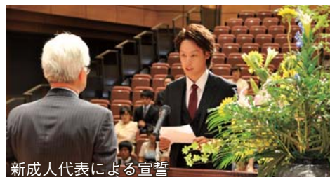
新成人代表による宣誓