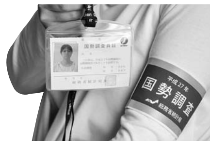
国勢調査員証と腕章

国勢調査をよそおった不審な訪問者や、不審な電話・電子メールなどにご注意ください。不審に思った際には、速やかに下記にお問い合わせください。