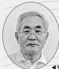
齋藤さんにとって写真とは…

感動する風景、きれいな花々、かわいい子どもたち、祭りの情景、おいしそうな食べ物など、日常目にするこれらの光景を写し撮るのが写真です。今ではスマホやデジカメで気軽に撮ることができます。撮った写真でいいものができたらうれしいものです。人にも見せたくなくてほめられたらまた撮りたくなるでしょう。撮った写真を思い出として残しておくのもいいと思いますが、多くの人に見ていただくのもいいものです。写真クラブへの入会となると敷居が高いかもしれませんが、意外と入りやすいものです。ぜひ楽しい写真生活を一緒に送みましょう。