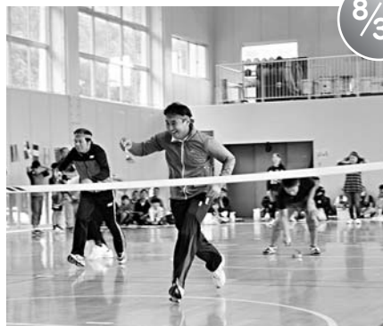
西部地区スポーツレクリエーション大会 (手ノ子小学校)