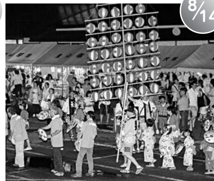
添川温泉ふるさと祭り (しらさぎ荘前広場)