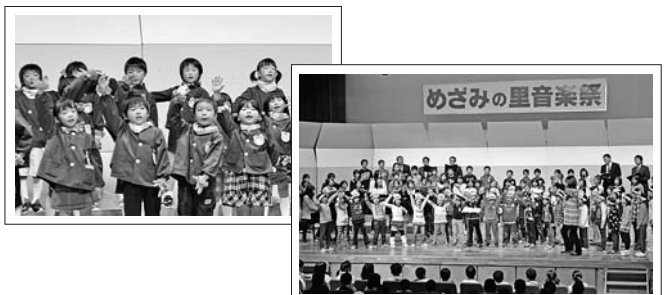
※昨年のめざみの里音楽祭の様子