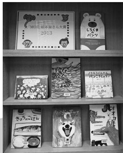
MOE絵本屋さん大賞2013特設コーナー

現在「あ～す」図書室では、「MOE絵本屋さん大賞2013」の特設コーナーを設けております。絵本屋さんを選んだベスト絵本をこの機会にぜひご覧になってみませんか？