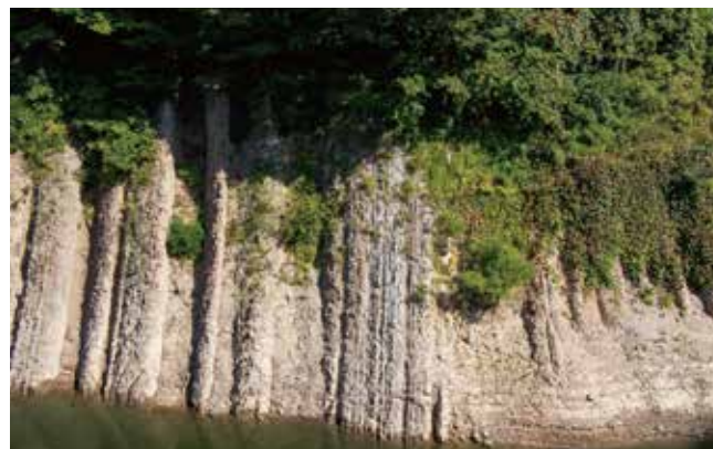
白川ダムの褶曲 MAP A D2