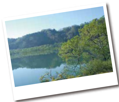
表紙の写真：白川湖の水没林（詳細は4P）